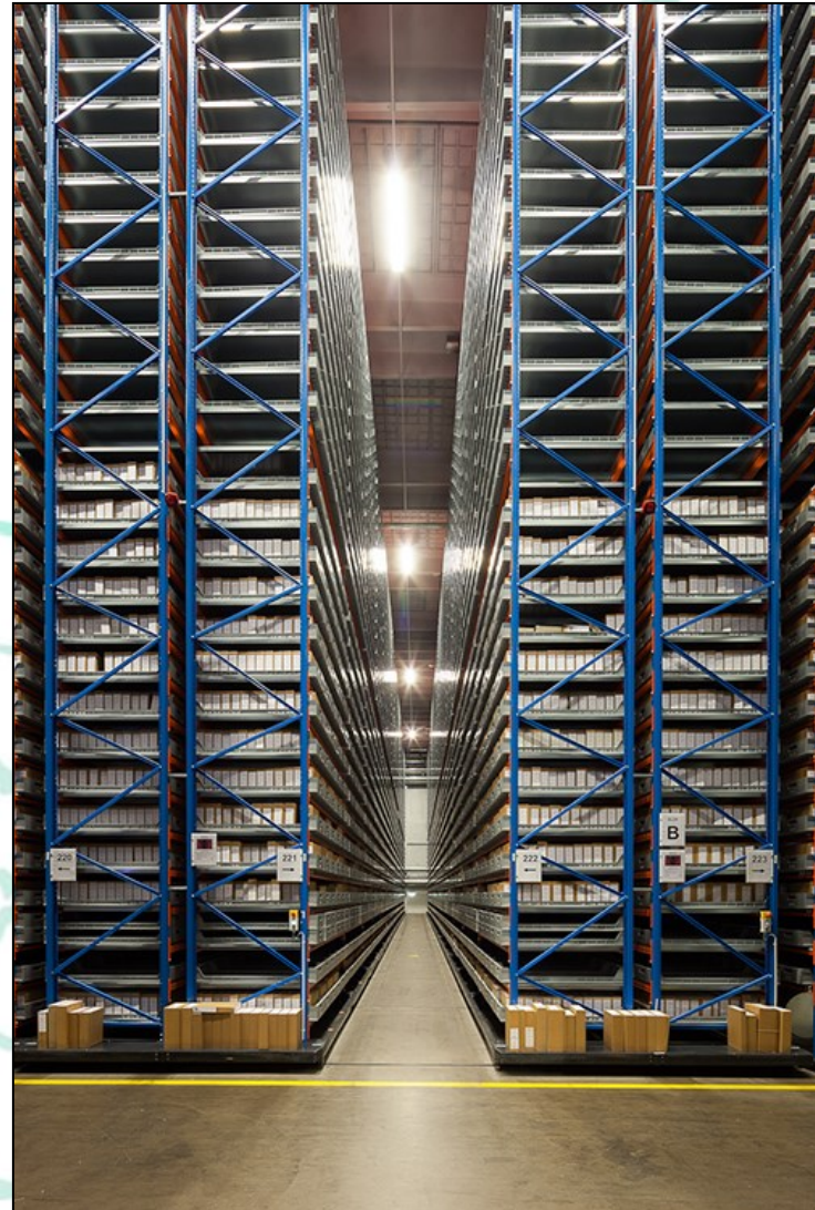
Foto fra Statens Arkivers magasiner på Kalvebod Brygge i København. Fotograf: T. Eskerod.